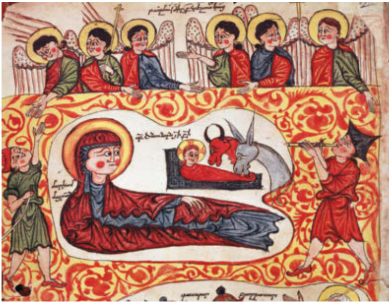
L'adoration des bergers, miniature de l'évangile de Vaspourakan, 12 e siècle, école arménienne.